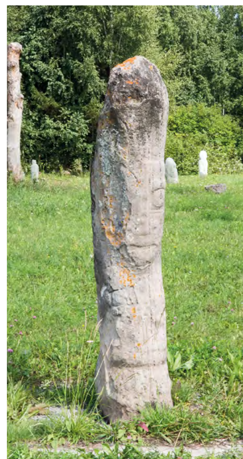
Изваяние окуневской культуры