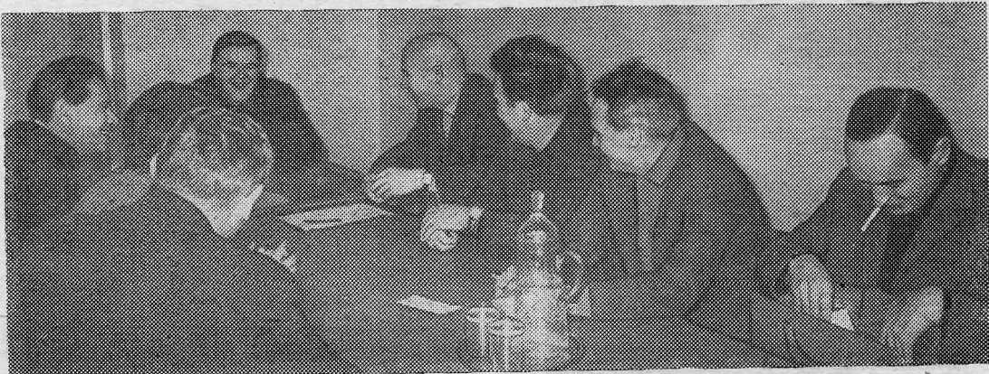
Заседание ученого совета Института геохимии.

коллектива, которым мы сейчас располагаем. Формирование института далеко не закончено. Впереди — строительство производственно-экспериментального корпуса, развертывание исследований существующих лабораторий и организация новых. Впереди много научных свершений. Нет сомнения в том, что наш боевой работоспособный коллектив делает достойный вклад в науку.