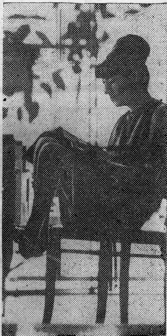
В обеденный перерыв.

стоятельства, немного — традиции в семье».