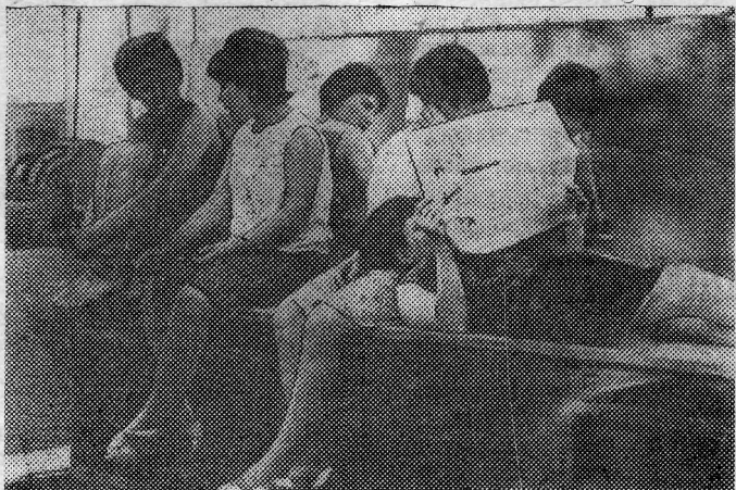
Удобны прилавки универмага, особенно в обеденный перерыв...

Ответы на него удивительно единодушны. Если сложить их вместе, получится вот такое обращение: «Товарищи покупатели, приходите к нам. Не судите нас торопливо, немножко больше теплоты... Не мы одни должны улыбаться... Оставьте за порогом универмага плохое настроение... Мы всегда вам рады».