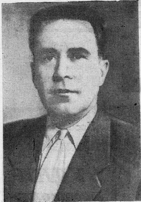
Член-корреспондент Академии наук СССР Константин Борисович КАРАНДЕЕВ.

Комитет стандартов, мер и измерительных приборов при Совете Министров СССР.