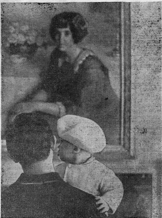
«Первое знакомство с искусством...»