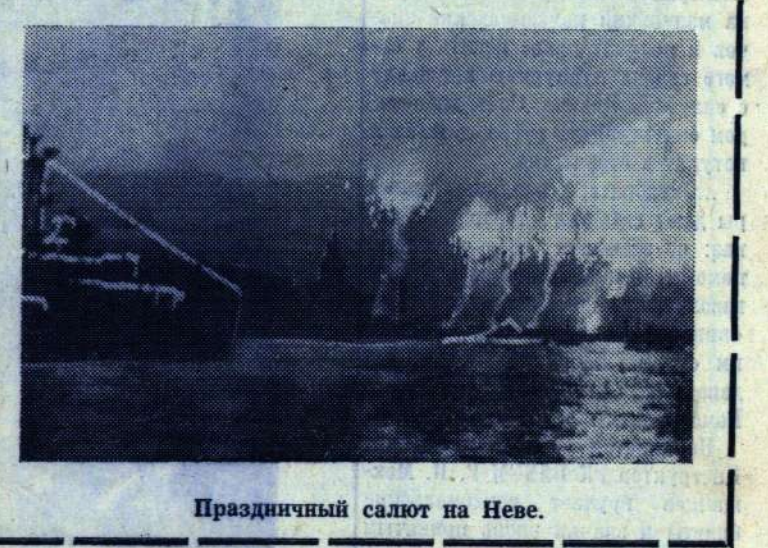
Праздничный салют на Неве.

из Петербурга руководил героической борьбой рабочих и крестьян России, спланировал ряды большевиков. Здесь, в Петербурге, в повседневном общении с рабочими, солдатами и матросами, В. И. Ленин подготовил и возглавил победоносное Октябрьское вооруженное восстание, открывшее новую эру — эру социализма и коммунизма. Ленинградцы свято и бережно хранят память о местах жизни и революционной деятельности вождя. В этом убеждаешься, когда попадаешь в Ленинград, где что ни дом, то мемориальная доска. Идешь по улицам и читаешь: «Здесь жил и работал В. И. Ленин». А с каким трепетным волнением осматриваешь вещи, которыми он пользовался. В Смольном на втором этаже в одной из комнат стоит этажерка для книг, письменный стол, телефон и