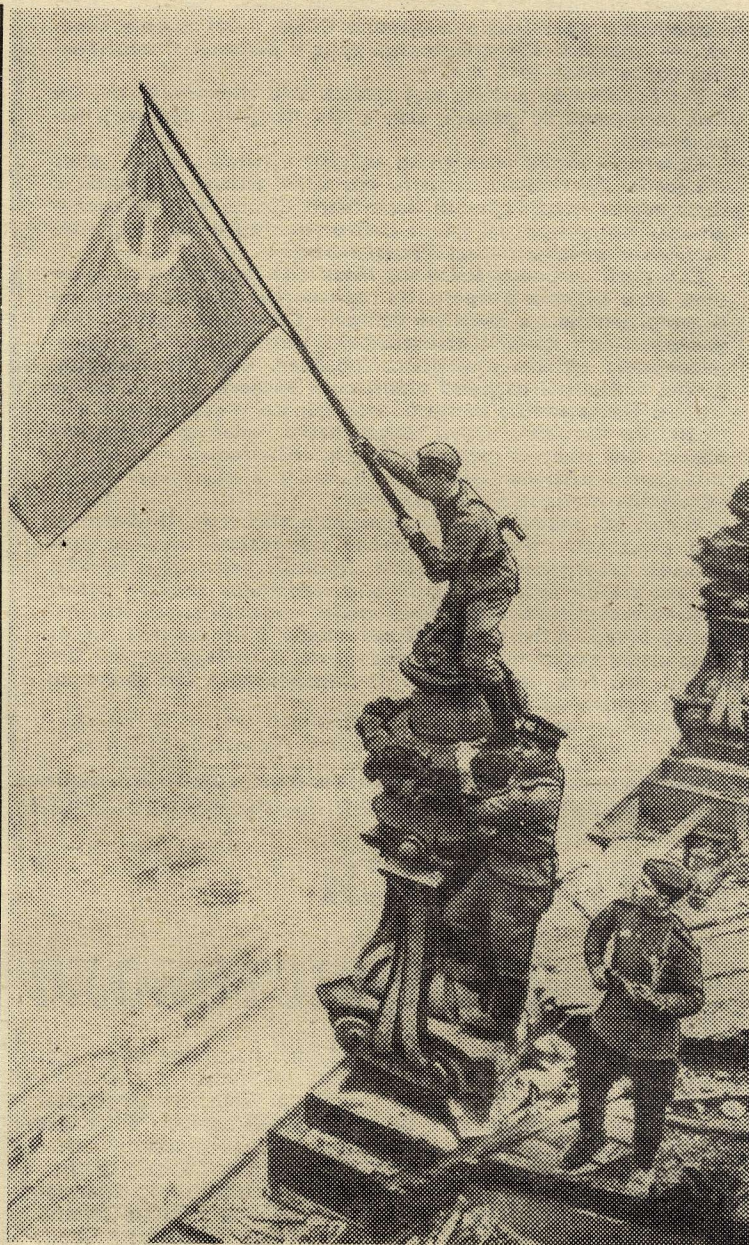
Знамя Победы над рейхстагом.

Советский РК КПСС г. Новосибирска. Советский райисполком. Совет ветеранов Великой Отечественной войны. Президиум Сибирского отделения АН СССР. Местный комитет профсоюза СО АН СССР. Советский РК ВЛКСМ г. Новосибирска.