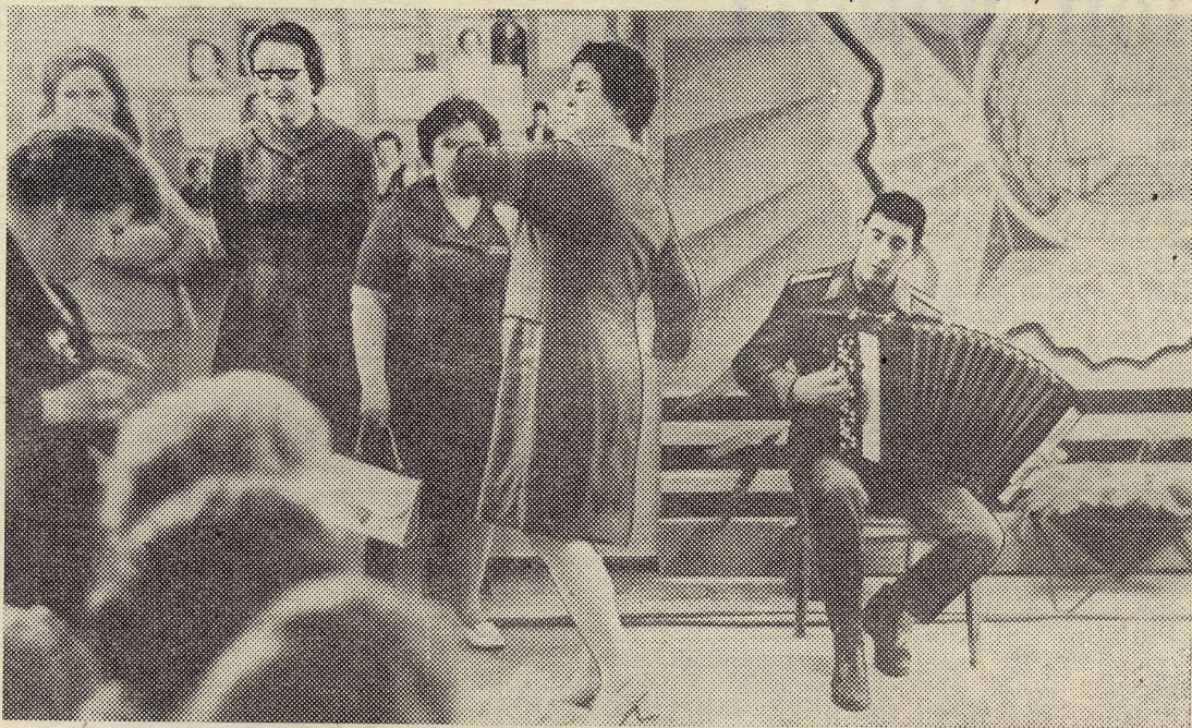
Они встретились, чтобы побыть вместе, поговорить, помолчать, попеть, сплясать...