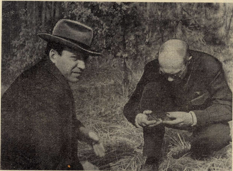
А. А. Ильющин (слева) и М. А. Лаврентьев рассматривают не- разорвавшийся немецкий снаряд. Киев, 1945 г.

Великая Отечественная война убедительно показала богатую мощь советского народа, несокрушимость социалистического строя. Советский народ вступил в единоборство с колоссальной военной машиной гитлеровской Германии, вобравшей экономические и военные ресурсы почти всей Западной Европы.